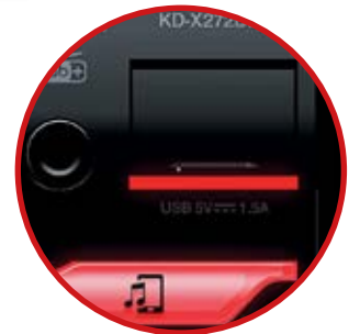
Port USB éclairé avec trappe de protection