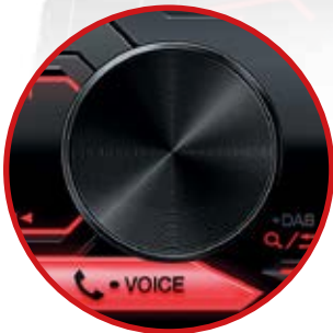
Bouton volume rotatif