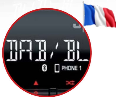
Menu en Français Afficheur LCD 13 Digits / 204 seg.