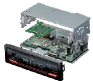
Châssis court 100 mm