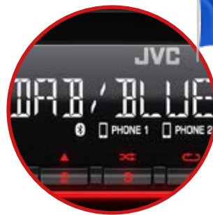
Menu en Français Afficheur LCD 13 Digits / 204 seg.