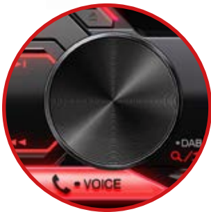
Bouton volume rotatif Touche directe TEL