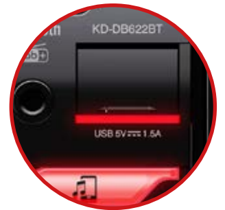
Port USB éclairé avec trappe de protection