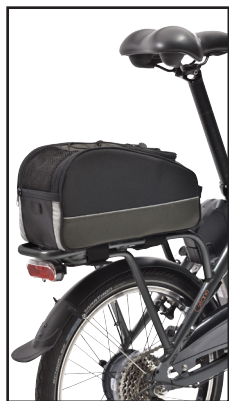
accessoires en option