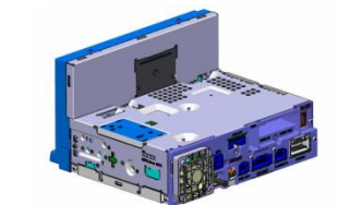
Châssis flexible sur demande