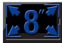
Ecran tactile 8" WVGA avec interface Cliquez Glissez