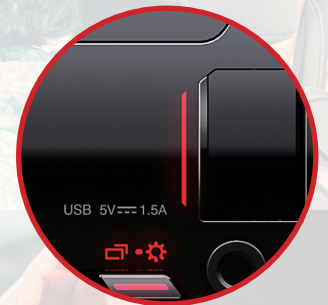
Port USB éclairé avec trappe de protection