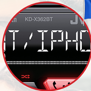
Menu en Français Afficheur LCD 13 Digits