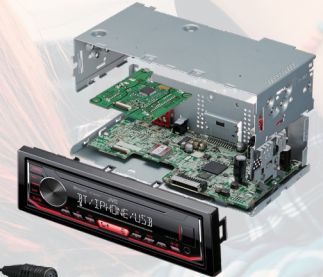
Châssis court 100 mm