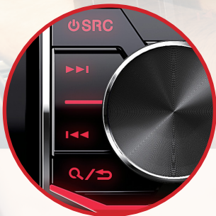
Liserets et bouton volume finition chrome